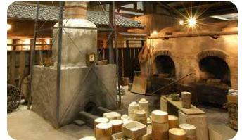
瀬戸蔵ミュージアム