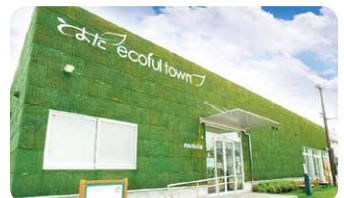
とよたエコフルタウン